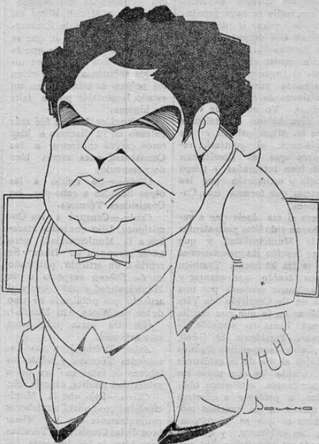
Caricatura de Solano